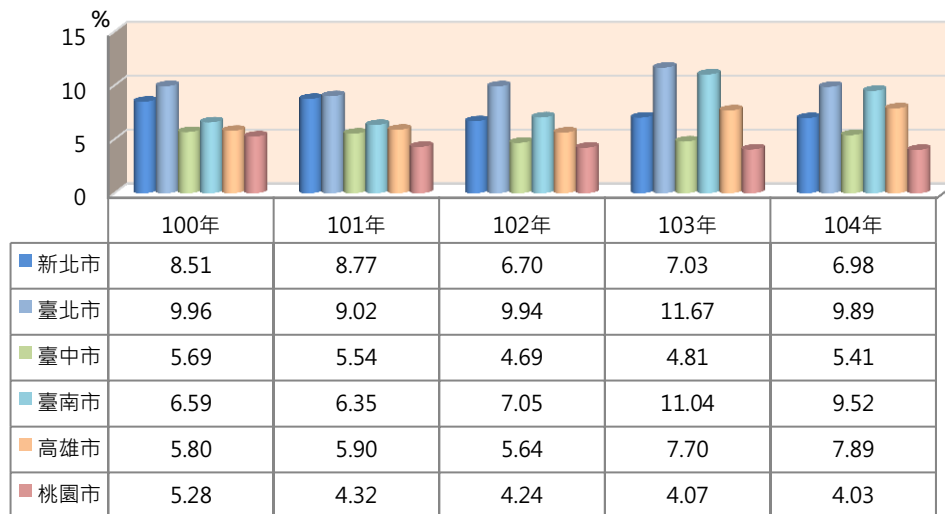
圖一 新北市近5年詐欺案占全般刑案比率

詐欺案係與治安最直接關係案類之一，近 5 年新北市詐欺犯罪發生數占全般刑案比率以 102 年 6.70% 最低，104 年 6.98% 居次低，且較 100 年 8.51% 下降 1.53 個百分點；若就六都進行比較，新北市詐欺案占全般刑案比率自 100 年六都第 2 高，進步至 104 年居六都第 3 低，顯見新北市詐欺犯罪偵防確有成效(圖一)。