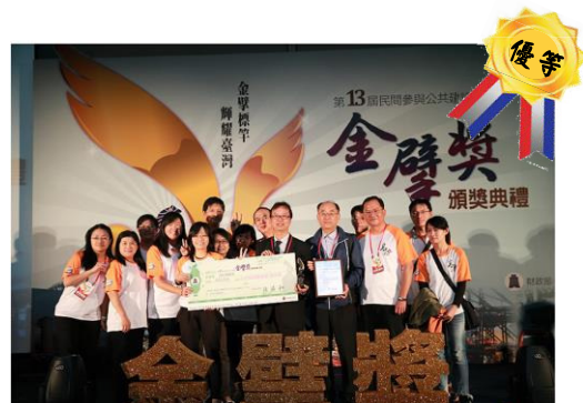
圖四 第 13 屆金擘獎政府機關團隊獎優等

除致力招商外，公共建設營運績效亦為全民所重視，金擘獎 17 的獲得無疑是營運效益最佳鼓勵，新北市新店溪高灘地臨時停車場營運移轉案與富基漁港魚產品銷售中心經營移轉案，於 104 年分別榮獲第 13 屆金擘獎政府機關團隊獎優等及佳等，為新北市民間參與公共建設營運績效再添佳績。新北市自改制升格以來積極與民間力量結合，不但善用民間創意、活力、效率與資源，更設置促進民間參與公共建設協調推動委員會，推動民間參與公共建設業務，期以透過新北市府的各项努力，提供市民更優質的公共服務，增進市民生活福祉。