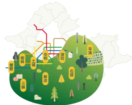
圖二 「微笑山線」旅遊品牌