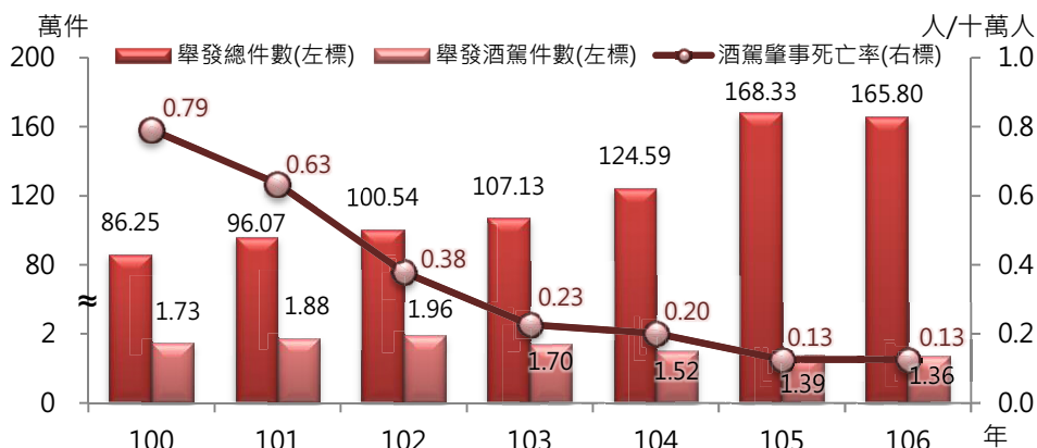
圖二 100年至106年新北市舉發違反道路管理事件及酒駕肇事情形

推出「取締危險駕駛」、「執行強化推動惡性交通違規」、「加強交通重點執法」及「防制危險駕車(飆車)」等多項專案，展現嚴格執法之決心。